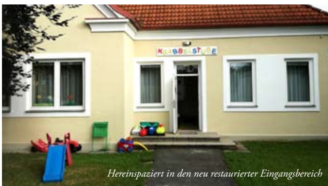
Hereinspaziert in den neu restaurierter Eingangsbereich

Ich freue mich auf Sie und Ihre Kinder! Bettina Aigner (Leiterin Krabbelstube)