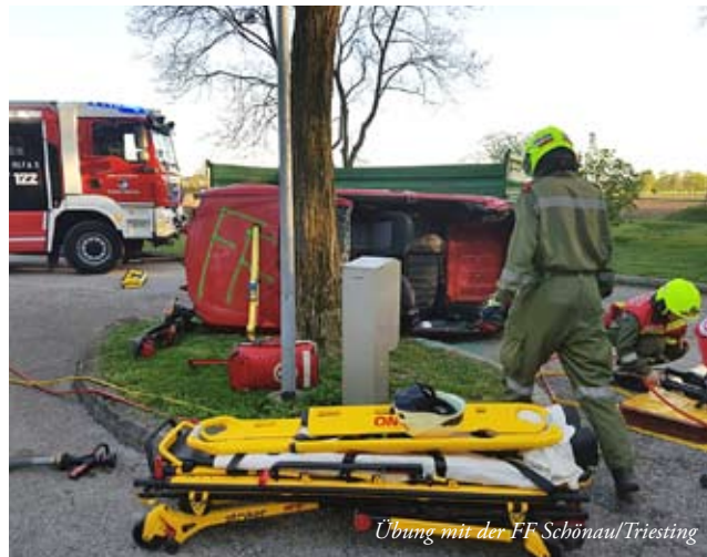
Übung mit der FF Schönau/Triesting

Am 28. April unterstützten wir die Freiwillige Feuerwehr Günselsdorf beim jährlichen Atemschutzleistungstest, auch als Finnentest bekannt.