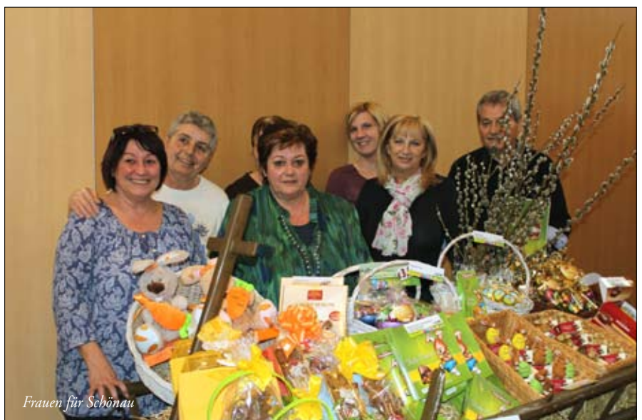
Frauen für Schönau