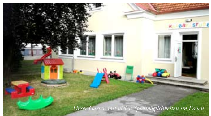
Unser Garten mit vielen Spielmöglichkeiten im Freien