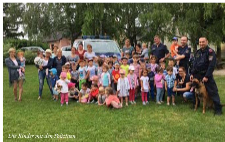
Die Kinder mit den Polizisten