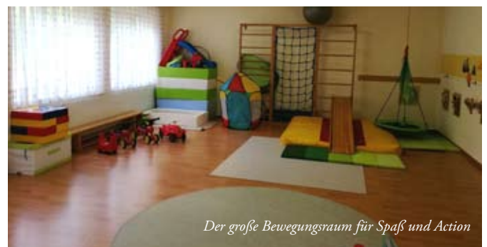
Der große Bewegungsraum für Spaß und Action