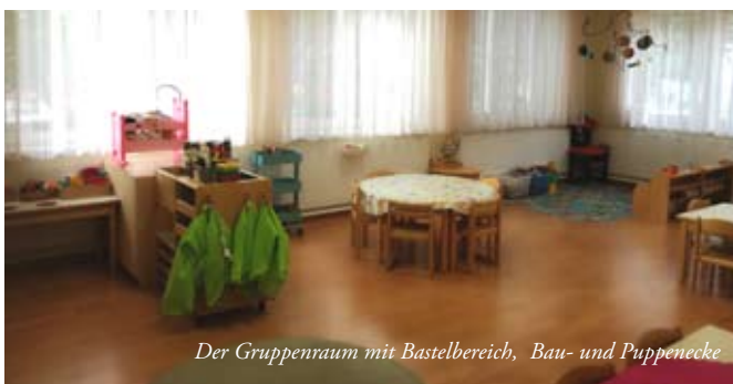
Der Gruppenraum mit Bastelbereich, Bau- und Puppenecke