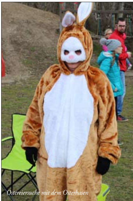
Ostereiersuche mit dem Osterhasen