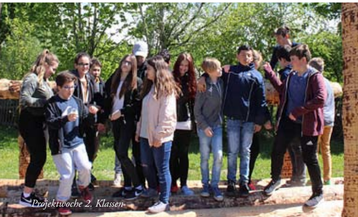
Projektwoche 2. Klassen

Das Schuljahr 2016/17 neigt sich dem Ende zu. Die KEL Gespräche fanden großen Anklang. Das Feedback, sowohl der Schülerinnen und Schüler, als auch der Eltern, war sehr positiv. Die Erziehungsberechtigten schätzen die Möglichkeit die eigenen Kinder bei der Präsentation zu erleben, und in Ruhe einige Minuten mit den jeweiligen Klassenvorständen zu sprechen. Für unsere Jugendlichen ist es eine wertvolle Erfahrung sich selber zu präsentieren, über eigene Stärken und Schwächen nachzudenken und vor den Eltern zu reden. In den dritten Klassen wurde wieder der Begabungskompass in Zusammenarbeit mit dem WIFI durchgeführt. Die Veranstaltung fand bei den Eltern großen Anklang.