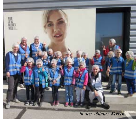
In den Vöslauer Werken

Ein wirklich schöner und sehr interessanter Ausgang!