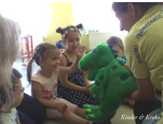
Kinder & Kroko

Für Rückfragen wegen ev. Beiträge oder Inseraten steht Ihnen Günther Heil von 07:00 bis 13:00 Uhr unter 02256/63572-12 bzw. via E-Mail unter heil@schoenautriesting.at gerne zur Verfügung.