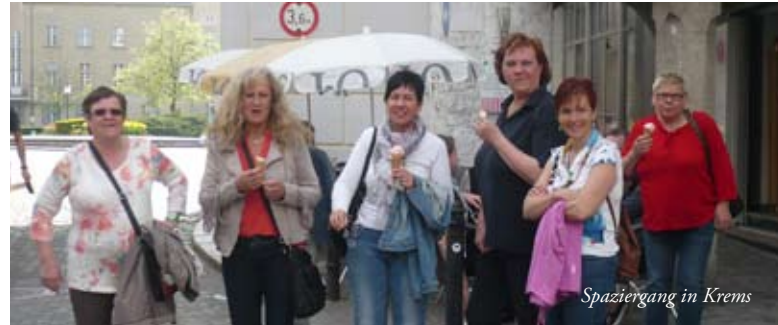
Spaziergang in Krems