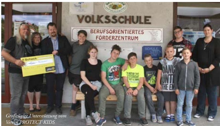
Großzügige Unterstützung vom Verein PROTECT KIDS