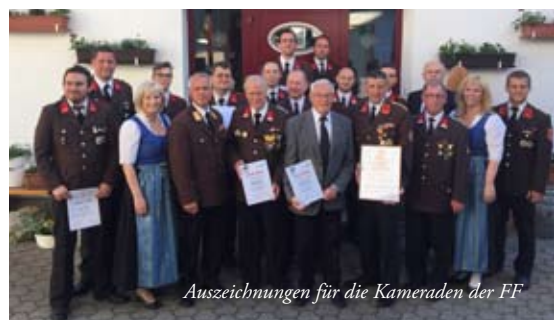
Auszeichnungen für die Kameraden der FF